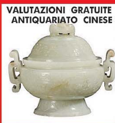
VALUTAZIONI GRATUITE ANTIQUARIATO CINESE