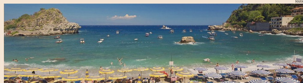
Lo scenario delle principali aree balneari italiane per il 2017

Un'buona mano - sottolineano dalla Jfc - arriva dagli stranieri che riconfermano un elevato livello di gradimento per le spiagge italia-