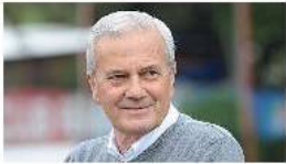
Gigi Simoni "continua a lottare" - Calcio