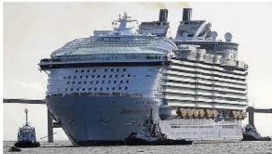
Bebè di 18 mesi muore in crociera - Mondo