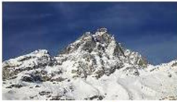
'Non ce la faccio più', muore su Cervino