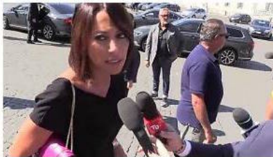
De Girolamo: "Oggi sono moglie, non commento ma si sa come la penso" - Italia