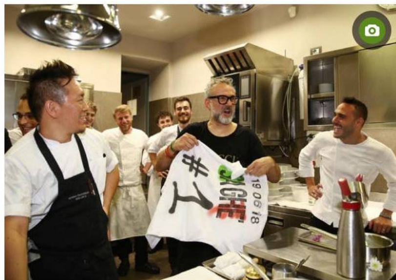
Massimo Bottura con la sua brigata