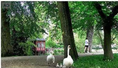
Solo in Danimarca si vive una vacanza da favola sulle tracce di Andersen Vacanze in Danimarca