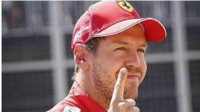
F1: Vettel "Una decisione assurda" - F1